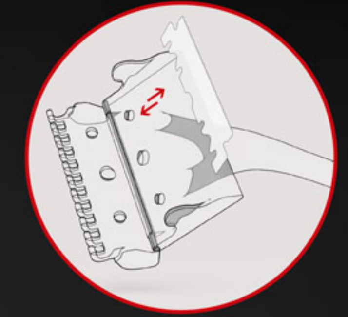
EXTRACCIÓN / INTRODUCCIÓN DE LA HOJA